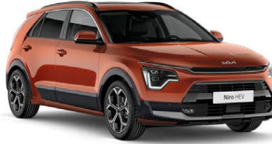
Delight Turuncu (DRG)