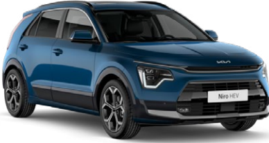
Mineral Mavi (M4B)