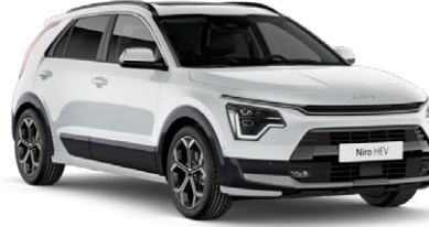
Snow Pearl Beyaz (SWP)