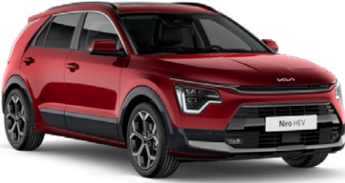
Runway Kırmızı (CR5)