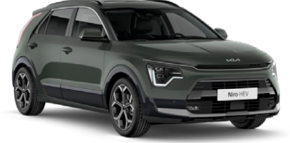
Cityscape Yeşil (CGE)