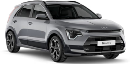
Steel Gri (KLG)