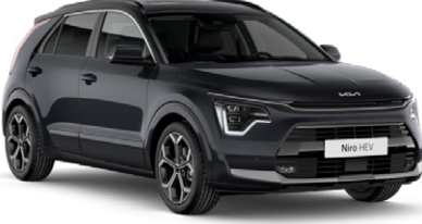
Aurora Pearl Siyah (ABP)