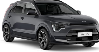
Interstellar Gri (AGT)