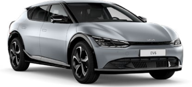
Mooncape Gri (KLM)