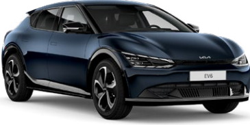
Gravity Mavi (B4U)