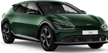
Deep Forest Yeşil (G4E)