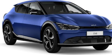
Yacht Mavi (DU3)