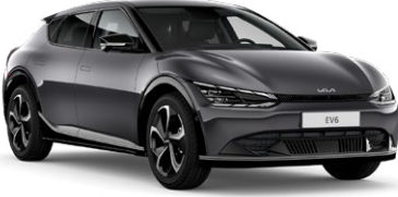
Interstellar Gri (AGT)