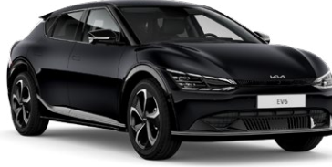
Aurora Pearl Siyah (ABP)