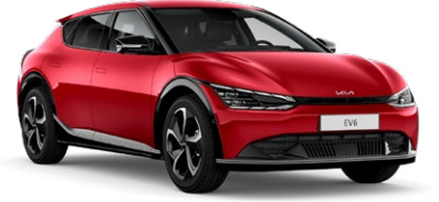
Runway Kırmızı (CR5)