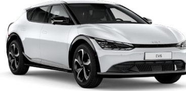
Snow Pearl Beyaz (SWP)