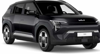
Aurora Pearl Siyah (ABP)