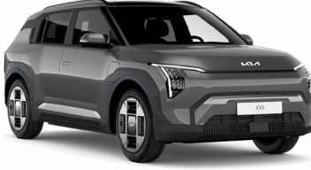
Shale Gri (EBD)