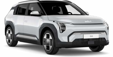
Snow Pearl Beyaz (SWP)