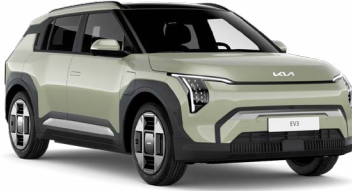
Aventurine Yeşil (AG3)