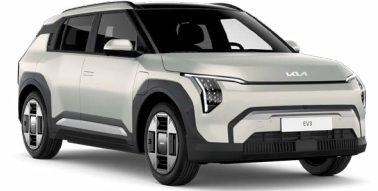
Ivory Gri Mat (ISM)