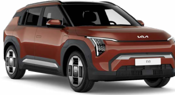
Terra Cotta Kırmızı (TCT)