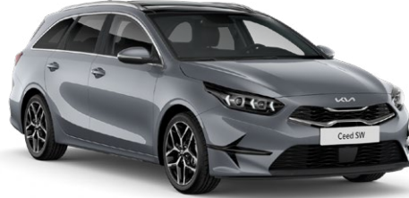
Aytaşı Gri (CSS)