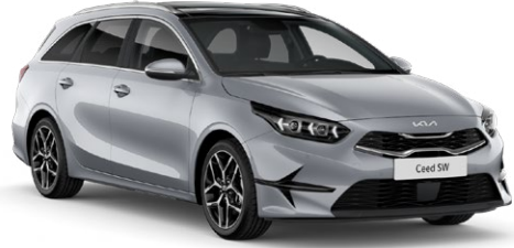
Gümüş Gri (KCS)