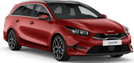
Manyetik Kırmızı (AA9)