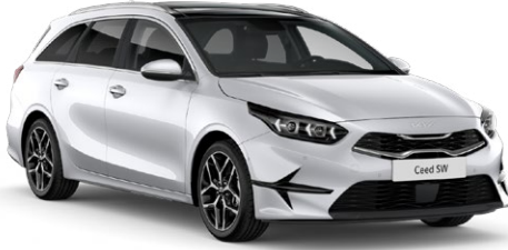
İnci Beyaz (HW2)