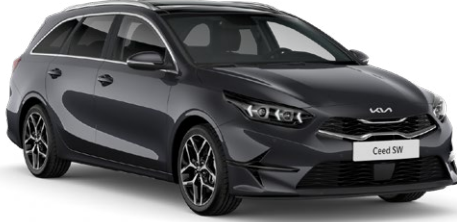
Fırtına Gri (H8G)